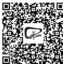
参考文献见二维码

引证本文: Chinese Society of Hepatology, Chinese Medical Association. Guidelines on the diagnosis and management of autoimmune hepatitis (2021) [J]. J Clin Hepatol, 2022, 38(1): 42-49.